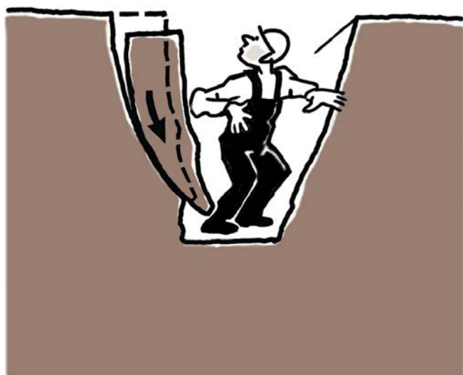
Även ett skred med liten utbredning kan bli farligt om schakten är smal. Illustration: Ingela Jondell

Oftast stöter man dessutom på flera av dessa jordarter, eller blandningar av dem, vid ett och samma schaktarbete. De flesta jordtyper har olika egenskaper beroende på mängden vatten i jorden. Detta kan ställa till med problem eftersom vattenförhållandena i jorden ändras med årstid och nederbörd. Att före schaktning veta exakt hur det ser ut under markytan och exakt hur jorden kommer uppföra sig är inte möjligt. Schaktarbetet måste därför hela tiden anpassas till rådande förhållanden och det går inte att schablonmässigt bestämma arbetssätt, släntlutning med mera.